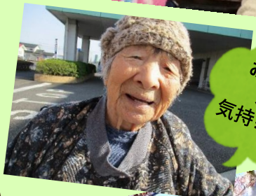
お散歩♪ 外は 気持ちいいね