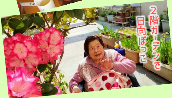
2階ガーデンで 日向ぼっこ