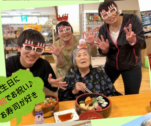
誕生日に 出勤でお祝い♪ お寿司が好き