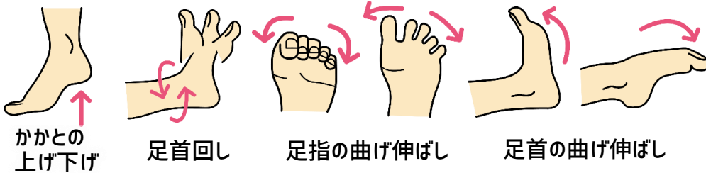
かかとの 上げ下げ