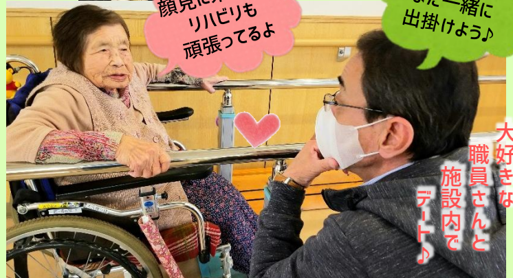
大好きな 職員さんと 施設内で デート♪