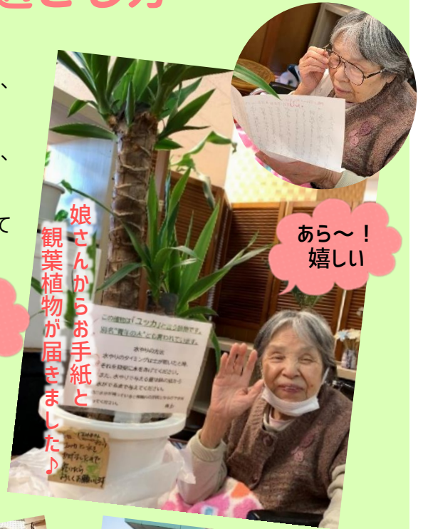
娘さんからお手紙と 観葉植物が届きました♪