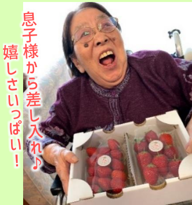
息子様から差し入れ♪ 嬉しさいっぱい!

私たち職員も、お年寄りの皆さんに、なるべく安心して過ごしていただけるよう関わらせていただいています。