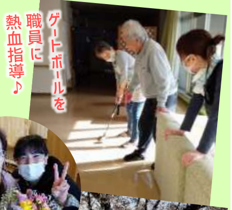
職員にゲートボールを熱血指導♪