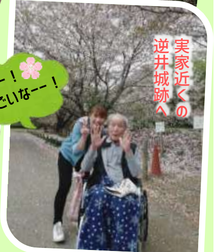
実家近くの逆井城跡へ