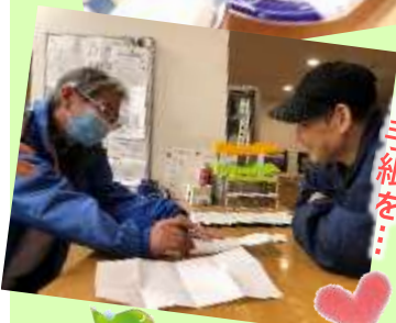
大好きな人へお手紙を...