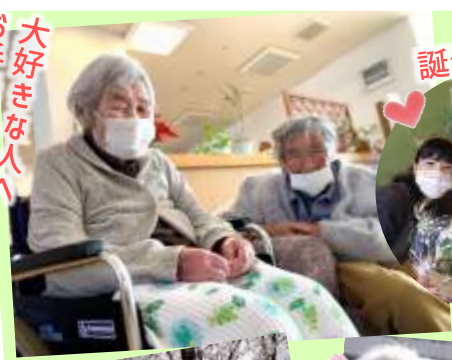
誕生日おめでとう!